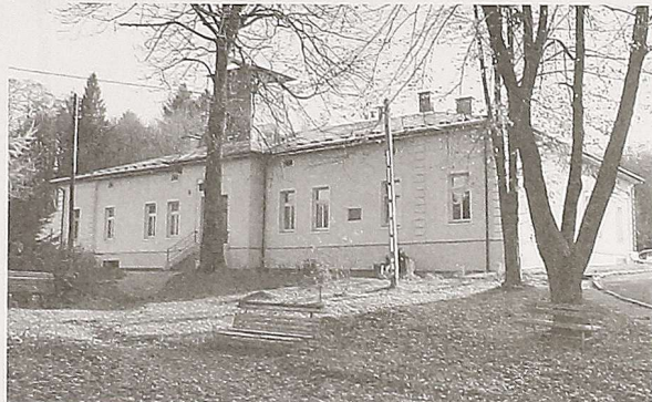
Szkoła w Łobozewie mieści się w dawnym dworze

Trwa kolejny etap remontu i modernizacji Szkoły Podstawowej w Łobozewie. Mieści się ona w XIX-wiecznym dworze Leszczyńskich. Dlatego przebudowuje się głównie jej wnętrze, zachowując bryłę budynku.