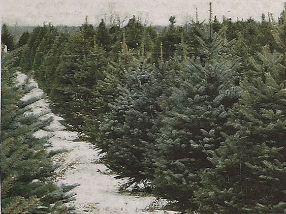
Naturalne choinki już czekają.

Tradycyjnie na początku grudnia zaczynamy czuć atmosferę świąt. Radio zaczyna katować nieśmiertelne „White Christmas”, w sklepach promocja świąteczna jest nawet na olej silnikowy, a my coraz częściej zastanawiamy się, jaką choinkę w tym roku postawimy w rogu gościnnego pokoju. I jak co roku w tym czasie namawiam wszystkich Państwa, aby postawić na choinkę naturalną.